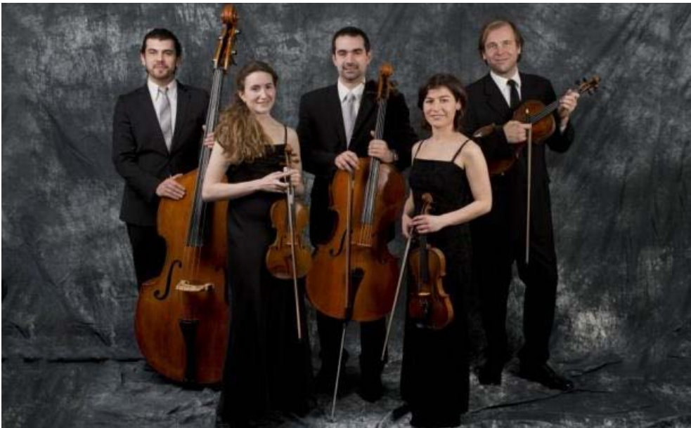
El Allegro Quintet se presentará el 6 de septiembre en una fecha imprescindible.